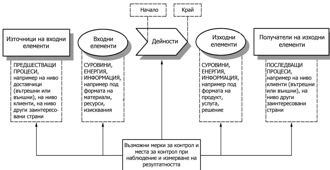
Фигура 1 – Схематично представяне на елементите на отделен процес

На фигура 1 е представен схематично отделен процес и е показано взаимодействието на неговите елементи. Местата за наблюдение и измерване, където е необходим контрол, са специфични за всеки процес и ще се променят в зависимост от рисковете, с които са свързани.